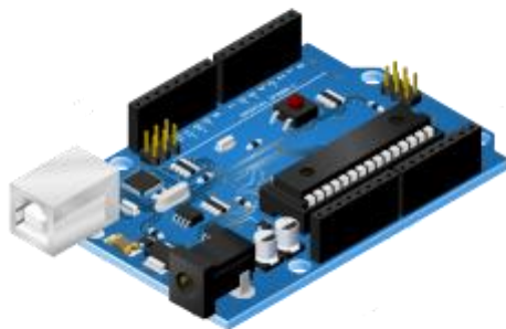
1 - Arduino Uno R3

Der Arduino ist ein Mikrocontroller, der günstig zu beschaffen und einfach zu programmieren ist. Mikrocontroller sind kleine Recheneinheiten, die ein Programm zur Zeit ausführen können. In technischen Produkten werden heute zuhauf Mikrocontroller eingesetzt: z. B. im Auto für die elektrischen Fensterheber oder die Schiebedachsteuerung. Aber auch in Haushaltsgeräten, wie Waschmaschinen und Trockner, werden einzelne Funktionen von Mikrocontrollern gesteuert.